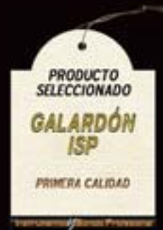
TABLA DE VALORACIÓN

que finalmente pagas (en gama media /alta) un buen dinero que no es inferior (en algunos casos) a lo que puede costarte este. Aunque los precios son razonables, no es un amplificador barato, pero dado lo exquisito en su construcción parece mostrar una buena relación calidad precio hablando de gama media/alta o alta.