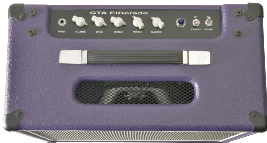
Panel frontal de El Dorado, con su original acabado custom en morado y su estética vintage, que deja a la vista el altavoz Celestion Vintage 30 que incorpora

y viva. El canal 2 tiene un comportamiento similar, pero con unas texturas más punzantes y vigorosas gracias a la válvula EF86. Al mezclar los dos canales puenteando las entradas, el abanico de tonalidades se amplía de una forma muy notable, permitiendo acceder a sonidos mucho más ricos y adictivos. Responde muy bien, tanto con guitarras con pastillas simples, como con guitarras con pastillas dobles. El Tornado tiene un peso más generoso que El Dorado, pero moderado (y es que nada tiene que ver con un "rompespaldas" tipo VOX). El tamaño es el típico de los combos de 30 vatios, algo intermedio. El Tornado se comercializa en varios formatos: combo de 1x12", combo de 2x12" y cabezal. 📺